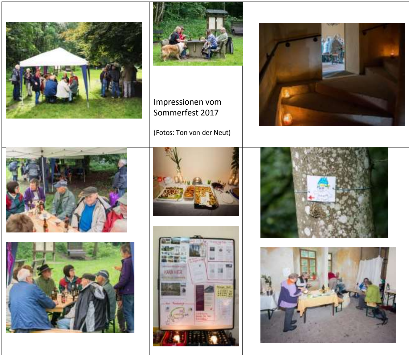
Impressionen vom Sommerfest 2017